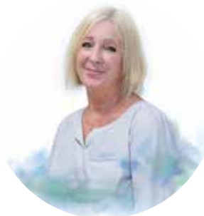
Bei Frau van der Vliet Wassersommelière & Ernährungsberaterin

Wenn Sie Ihr Wissen rund um das Thema Mineralwasser vertiefen möchten, können Sie an unseren auf Ihre Gruppe abgestimmten Mineralwasserschulungen zum Thema Wasser & Wein, Wasser in der Gastronomie und Wasser & Gesundheit teilnehmen. Auch hier können Sie individuelle Termine mit uns vereinbaren.